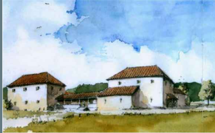
Rekonstruktionsvorschlag des römischen Gutshofs von Eigeltingen mit Haupthaus li. und Nebengebäude re. (U. Seitz)

Der römische Gutshof Eigeltingen wurde vermutlich in der zweiten Hälfte des 1. Jahrhunderts n. Chr. gegründet.